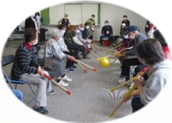
*写真は別のサロンの様子です。