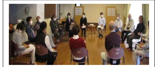
（パートナーさんとの交流会の様子）

4/27、泉心荘にてオレンジパートナー13名が 参加され活動報告や情報交換をする事ができました。 現在、西部地域にはサポーターからステップアップした 31名のパートナーさんが活動協力の登録をして 下さっています。ご協力ありがとうございます♥