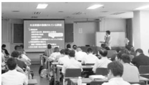
養成研修には参加法人から29名のCSWが参加。既存の法制度の理解と活用を十分に検討した上で、狭間のニーズを探る相談支援のキーマンとして期待されます

7月には、全3日間のCSW養成研修を実施しました。本事業のキーパーソンは何といってもCSWの方々です。今後も依存症やDV、債権整理などテーマ別の研修や、10月には大阪府社協の開催